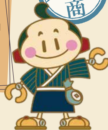
松阪商人サポート隊キャラクター 豪商あっさいくん