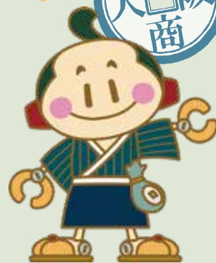
松阪商人サポート隊キャラクター 豪商あつきくん

松阪市内で新しく創業を考えている方、事業の継続や更なる成長を考えている方など、新たな事業展開を目指す方のためのきっかけとなるセミナーです。