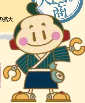
松阪商人サポート隊キャラクター 豪商あつきいくん